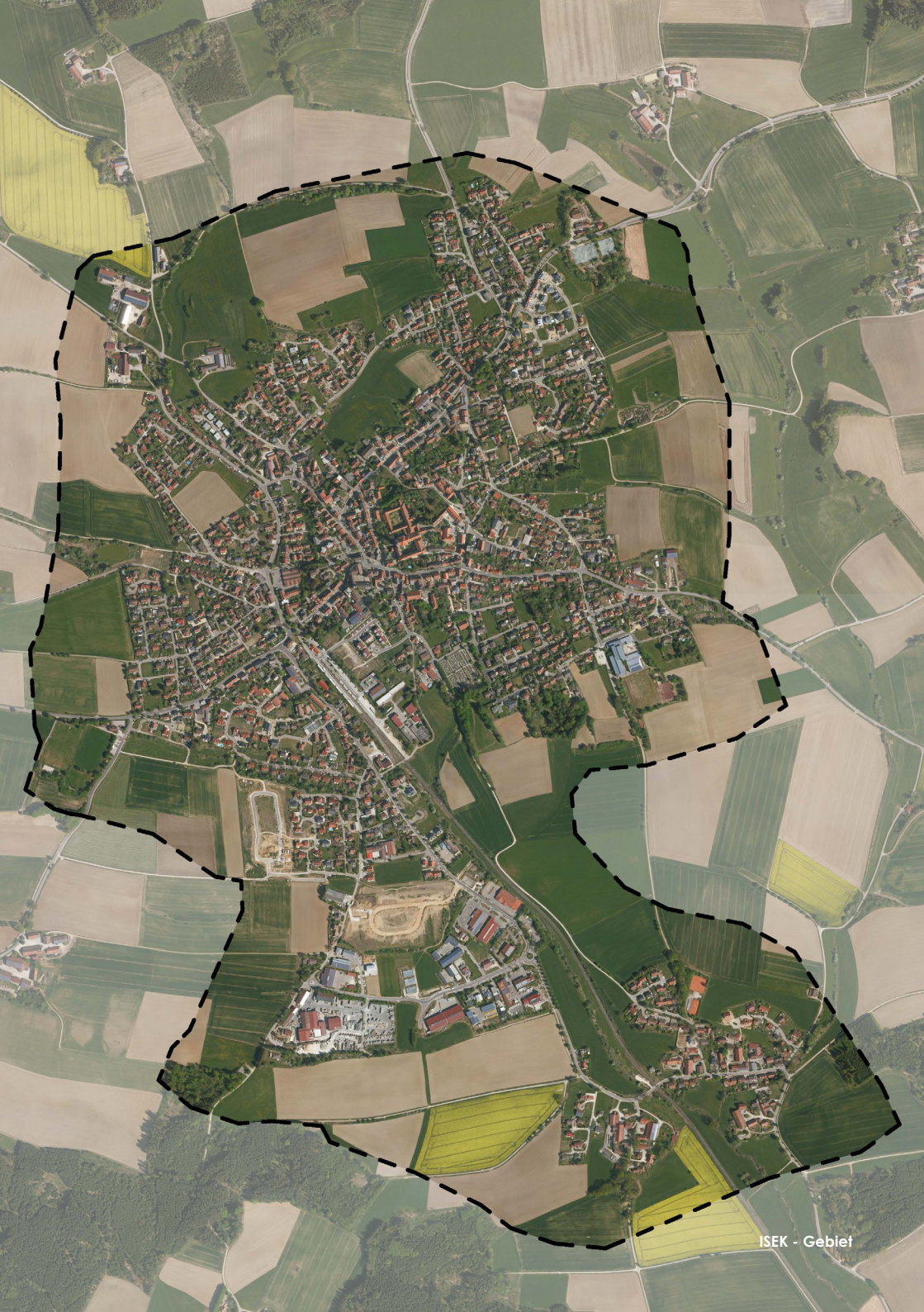
ISEK - Gebiet